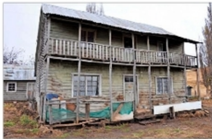
Casa Medina Muñoz (1935), con 205 m 2 , albergó a una familia de colonos que llegó a tener once integrantes.

Esta y otra serie de casas históricas de la ciudad son el objetivo de un inventario que está a punto de finalizar tras un año y medio de trabajo llevado a cabo por un equipo independiente de arquitectos, historiadores e investigadores. Ha puesto en la mira la importancia del registro de es-