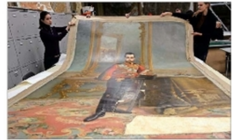
El retrato del zar Nicolás II, descubierto durante la restauración, data de 1896 y fue realizado por Ilya Galkin.

"Actualmente quedan muy pocos tejedores dedicados a elaborar la tejería artesanal, rajada en sentido de la hebra natural. Es un oficio que está en retirada de los bosques debido a que la demanda es muy baja. Además es caro construir con